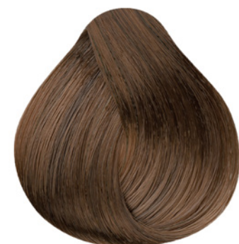
5.3 - Castanho Claro Dourado