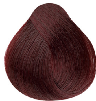
6.66 - Louro Escuro Vermelho Intenso