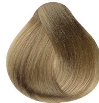
9.31 - Louro Muito Claro Dourado Cinza