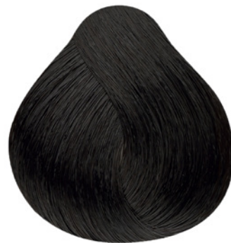
3.0 - Castanho Escuro