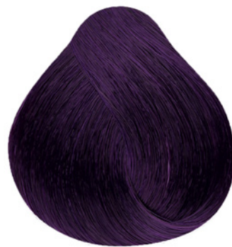
.22 - Mix Violeta (Irisado)