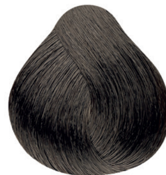
5.1 - Castanho Claro Cinza