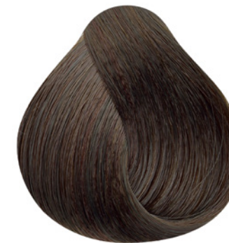
5.0 - Castanho Claro