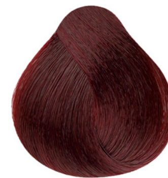
66.46 - Louro Escuro Cobre Vermelho Especial