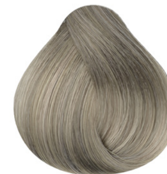
10.1 - Louro Claríssimo Cinza