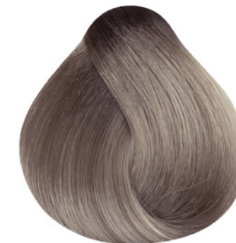
M12 - Matizador Cinza Irisado