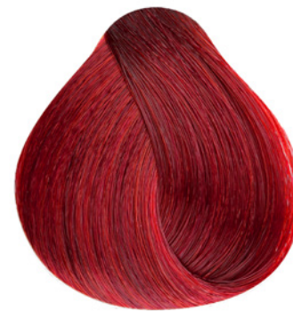
.66 - Mix Vermelho