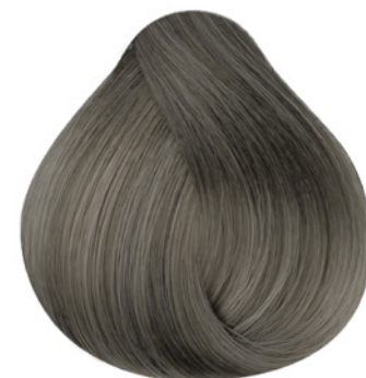
7.12 - Louro Médio Cinza Irisado