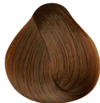
7.4 - Louro Médio Cobre