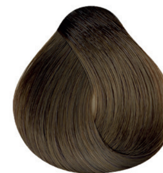
8.73 - Louro Claro Marrom Dourado