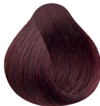
6.26 - Louro Escuro Irisado Vermelho