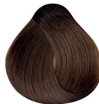
6.37 - Louro Escuro Dourado Marrom