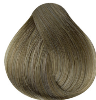
8.1 - Louro Claro Cinza