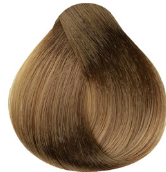
7.3 - Louro Médio Dourado