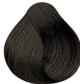
5.73 - Castanho Claro Marrom Dourado