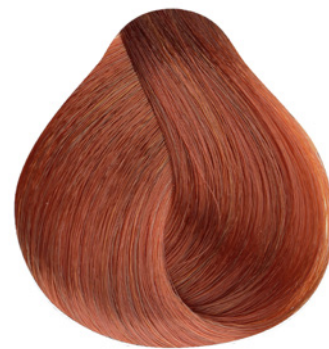
.44 - Mix Cobre