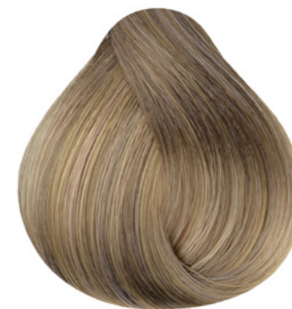
9.0 - Louro Muito Claro