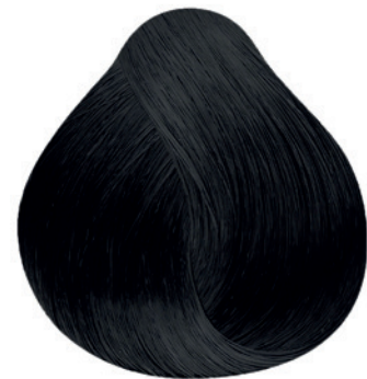
1.0 - Preto