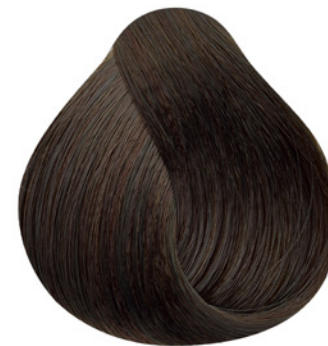
4.0 - Castanho Médio