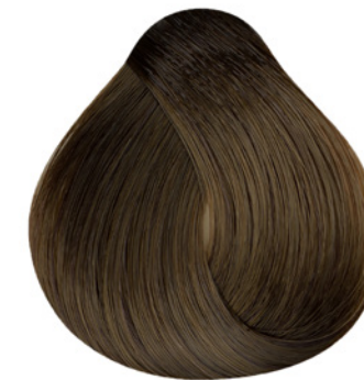
6.0 - Louro Escuro