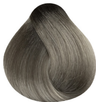
.11 - Mix Cinza