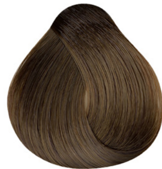
7.31 - Louro Médio Dourado Cinza