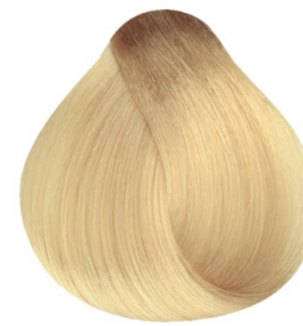
10.3 - Louro Claríssimo Dourado