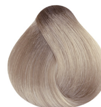
10.2 - Louro Claríssimo Irisado