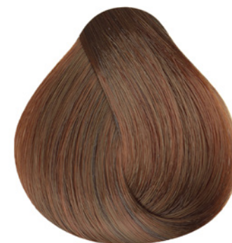
8.34 - Louro Claro Dourado Cobre