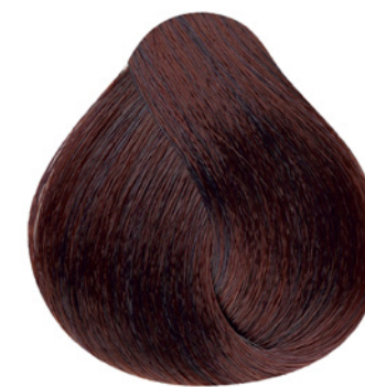
66.62 - Louro Escuro Vermelho Especial Irisado