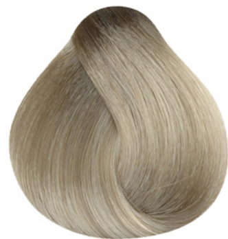
12.12 - Ultra Clareador Cinza Irisado