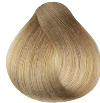
9.3 - Louro Muito Claro Dourado