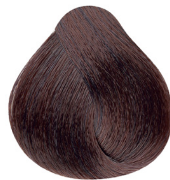
6.65 - Louro Escuro Vermelho Acaju