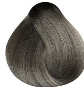
M11 - Matizador Cinza Intenso