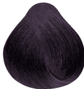
5.22 - Castanho Claro Irisado Intenso