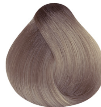
9.21 - Louro Muito Claro Irisado Cinza